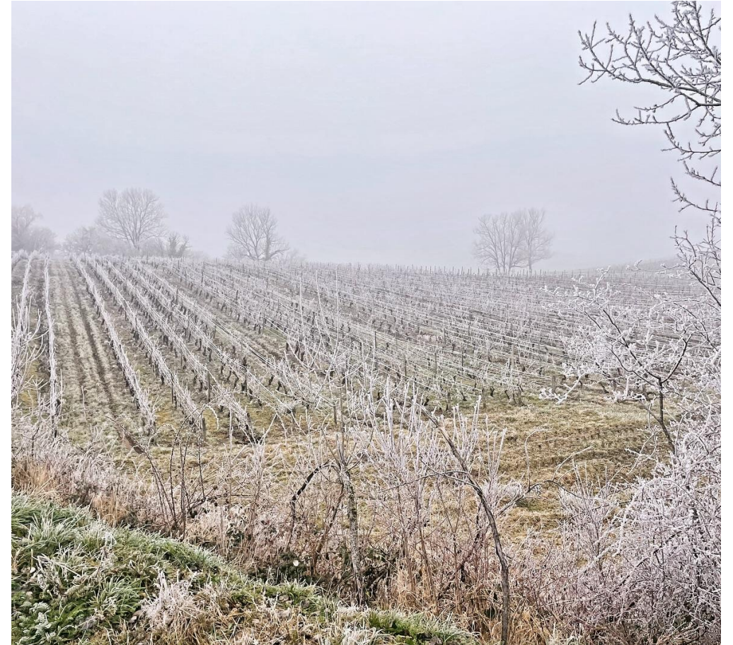
Frost i Jura, april 2024