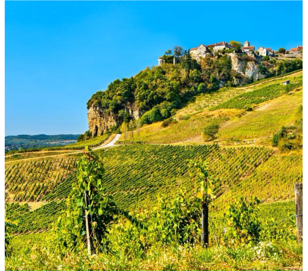
Chateau Chalon og dets vinmarker