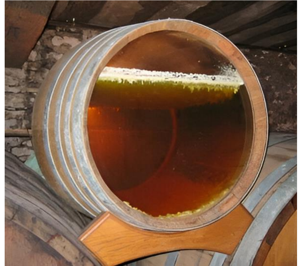
Voile: (no. slør) er laget av døde gjærceller som beskytter vinen mot oksidasjon.