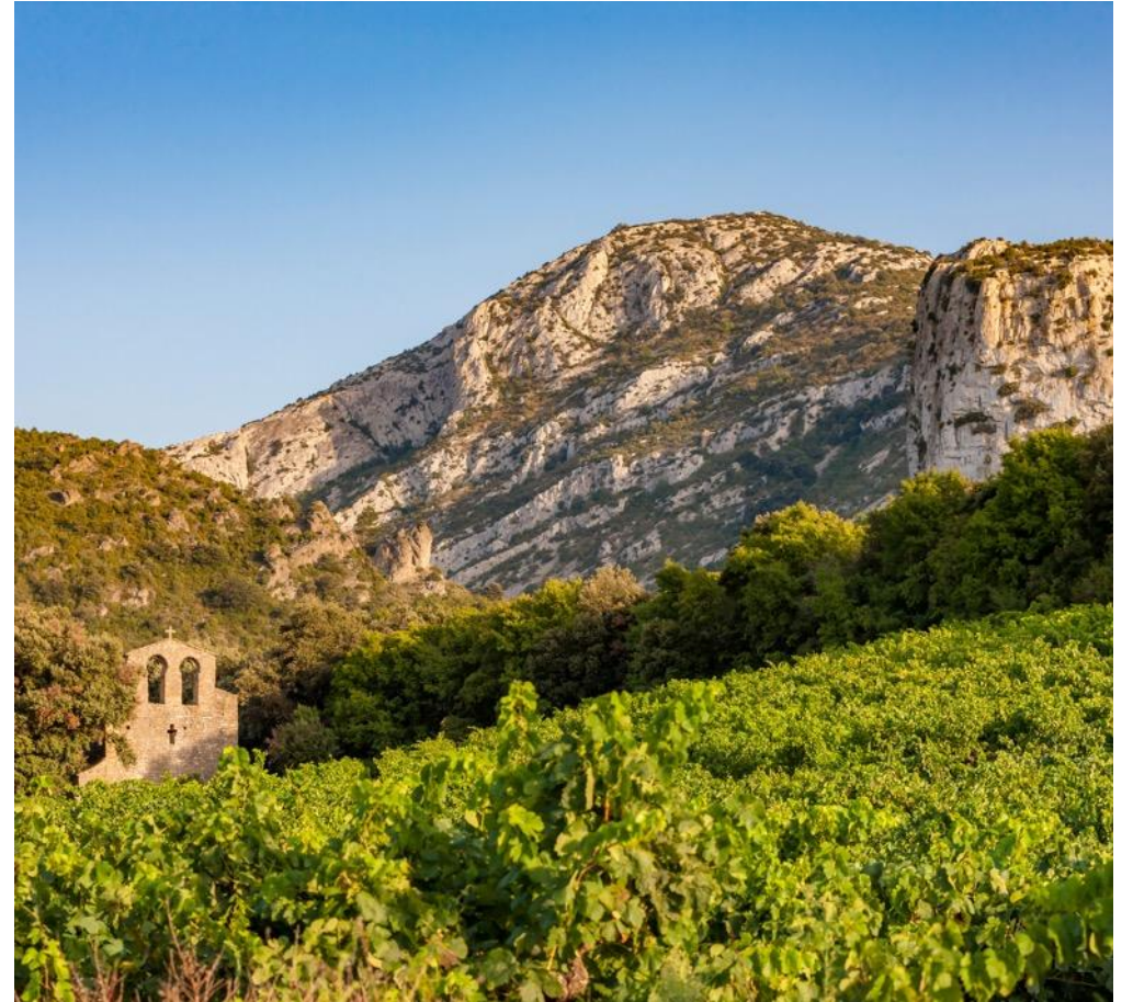
Domaine de Cauvy, Languedoc Roussillon